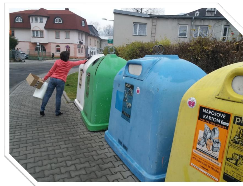
Zdroj: Město Jeseník

analýza, která zjistila, že dvě třetiny odpadu končí ve směsném odpadu zbytečně, protože by mohla být dále dotříděna. Oblast odpadového hospodářství ve vazbě na energetickou využitelnost je řešena i na regionální úrovni v rámci Sdružení měst s obcí Jesenícka.